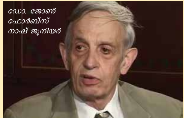
ഡോ. ജോൺ ഫോർബ്സ് നാഷ് ജൂനിയർ

കേന്ദ്രീകരിച്ചിരിക്കുകയാണ്. ന്യൂകാസിൽ സർവ്വകലാശാലയിൽ നടത്തപ്പെട്ട പഠനങ്ങളിൽ കലാപരമായ സർഗ്ഗശക്തിയുള്ള വ്യക്തികളും ഗണിതശാസ്ത്രജ്ഞന്മാരും തമ്മിൽ കാര്യമായ വ്യത്യാസമുള്ളതായി കണ്ടെത്തി. കലാകാരന്മാരിൽ മതിഭ്രമത്തിന്റെ അംശങ്ങൾ കൂടുതലായി കണ്ടപ്പോൾ ഗണിതശാസ്ത്രജ്ഞന്മാരിൽ ഓട്ടിസത്തിന്റെ ലക്ഷണങ്ങളാണ് കാണപ്പെട്ടത്.