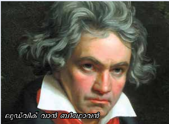
ലൂഡ്വിഗ് വാൻ ബീമോവൻ